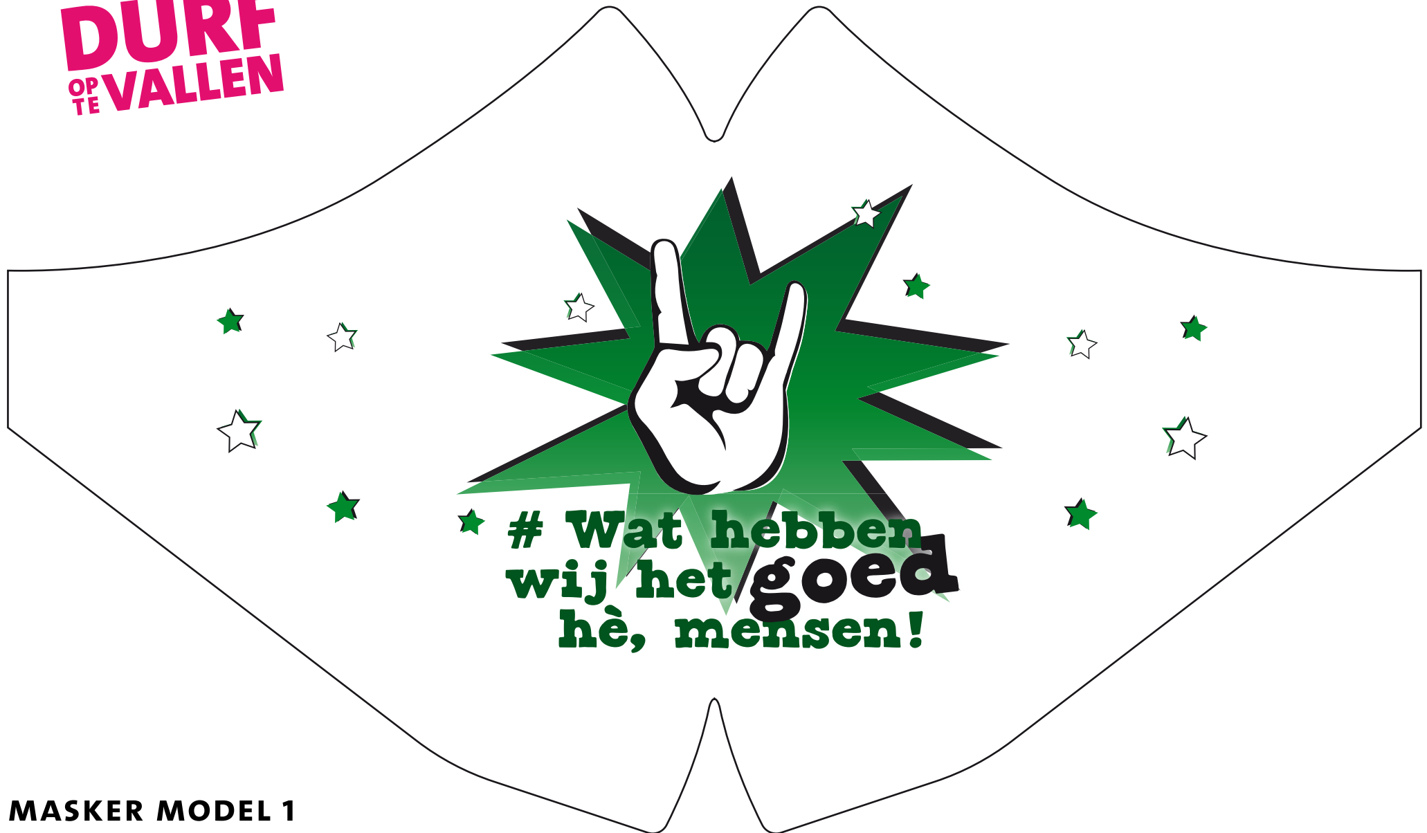
MASKER MODEL 1

Gebruik deze tekening voor bijk een logo links en rechts, of een beeld/foto in het vlak.